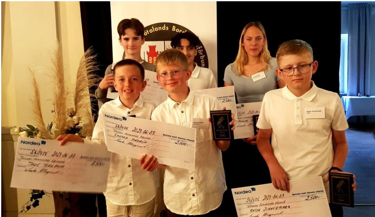
Bild: Prisutdelning på Pingisgalan med stipendier från Olles Fond.