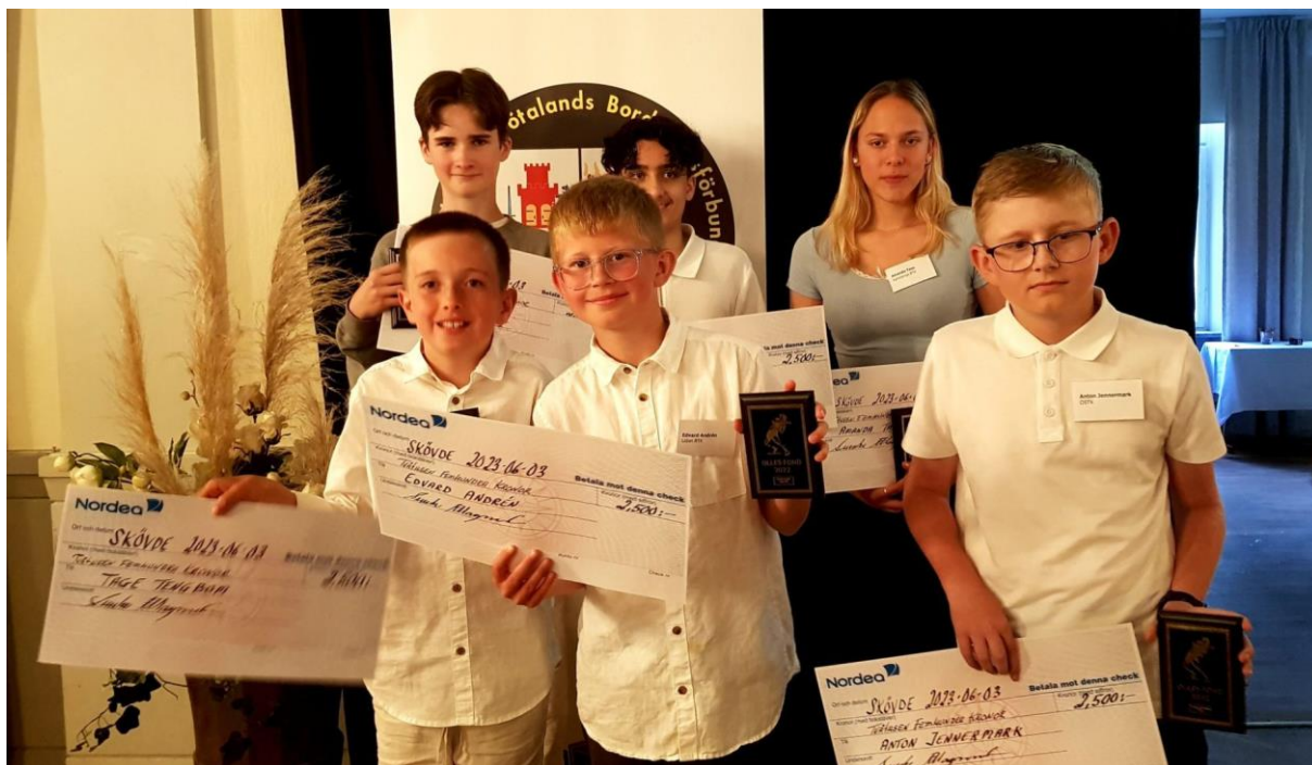
Bild: Prisutdelning på Pingisgalan med stipendiater från Olles Fond.